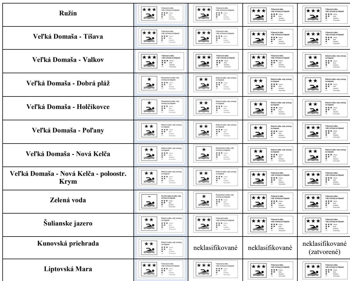
Tab.1: Prehľad kvality VUK na Slovensku počas kúpacích sezón 2021 – 2018