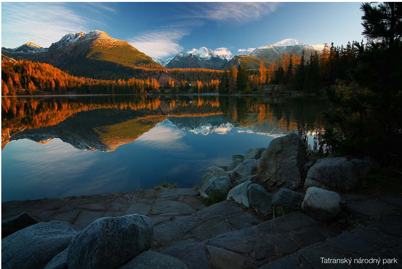
Tatranský národný park