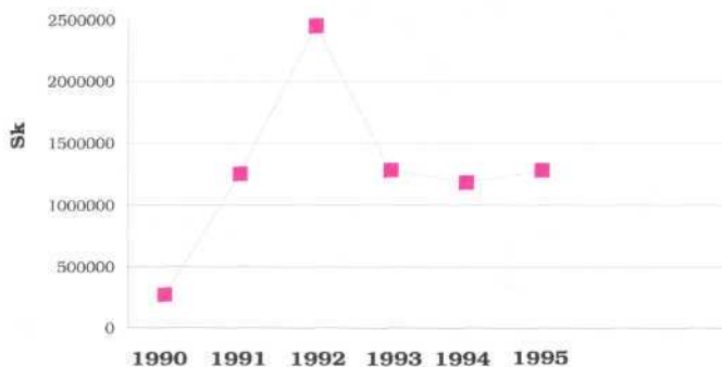
Graf č. VII. 1 Skutočné výdavky štátneho rozpočtu v kapitole MŽP SR (tis. Sk)

Výdavky zo štátneho rozpočtu SR v kapitole MŽP SR predstavovali v roku 1995 1 404 844 tis. Sk, čo oproti roku 1994 je nárast o 300 422 tis. Sk. Z uvedeného objemu finančných prostriedkov dotácia do štátneho fondu životného prostredia (ŠFŽP) SR predstavovala 250 000 tis. Sk, čo je najnižšia dotácia od roku 1991-