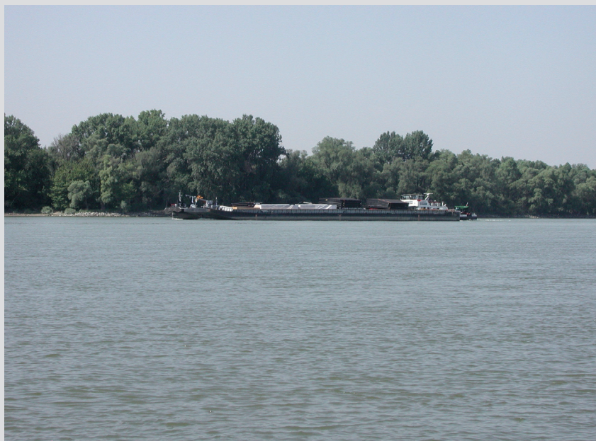
Foto 3: Pri vnútrozemskej plavbe, resp. pri budovaní, prevádzke a údržbe vodných ciest je tiež riziko vzniku environmentálnej škody na chránených biotopoch a druhoch (napr. rybách).

http://enviportal.sk/environmentalne-temy/vybrane-environmentalne-problemy/environmentalne-skody/informacny-system-es