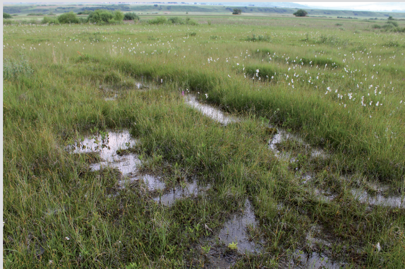
Foto 8: Biotopy rašelinísk sú mimoriadne citlivé na akékoľvek zmeny vodného režimu ako aj na zmeny v kvalite vody. Ak sú obklopené intenzívne využívanou poľnohospodárskou krajinou, výrazne stúpa možné riziko vzniku environmentálnej škody.

drevín, priestorová štruktúra, prítomnosť hrubých stromov a hrubého mŕtveho dreva, zdravotný stav porastu a širšie priestorové súvislosti. Pri nelesných biotopoch sa pri hodnotení vychádza z nasledovných parametrov: počet charakteristických taxónov, počet indikačných taxónov, vertikálna štruktúra – pokryvnosť jednotlivých etáží, veľkosť lokality, prítomnosť invázií neofytov a expanzívnych taxónov.