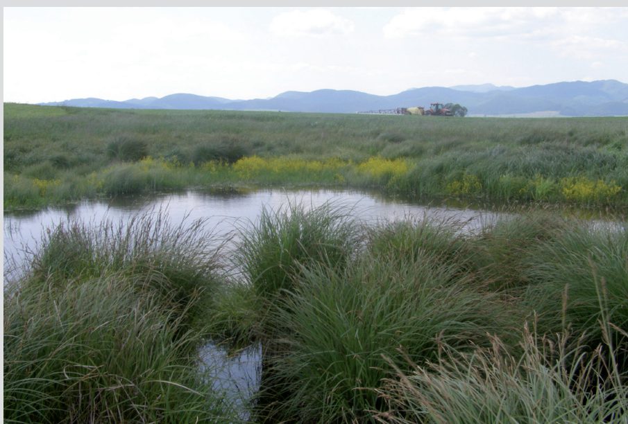
Foto 15: Aplikácia chemických látok a hnojív na poľnohospodárskej pôde predstavuje bežný spôsob obhospodarovania, aj keď vo vyššom stupni územnej ochrany podlieha súhlasu orgánu ochrany prírody. Ak sa vykonáva na plochách v bezprostrednom kontakte s chránenými územiami, môže spôsobiť vznik environmentálnej škody na chránených druhoch a biotopoch.