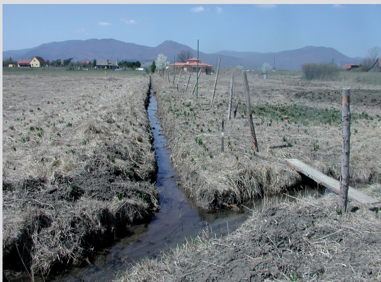
Foto 10: Hydromeliorácie pozemkov za účelom ich poľnohospodárskeho alebo lesohospodárskeho využitia alebo ochrany stavieb sú najčastejšou príčinou ohrozenia mokradových biotopov.