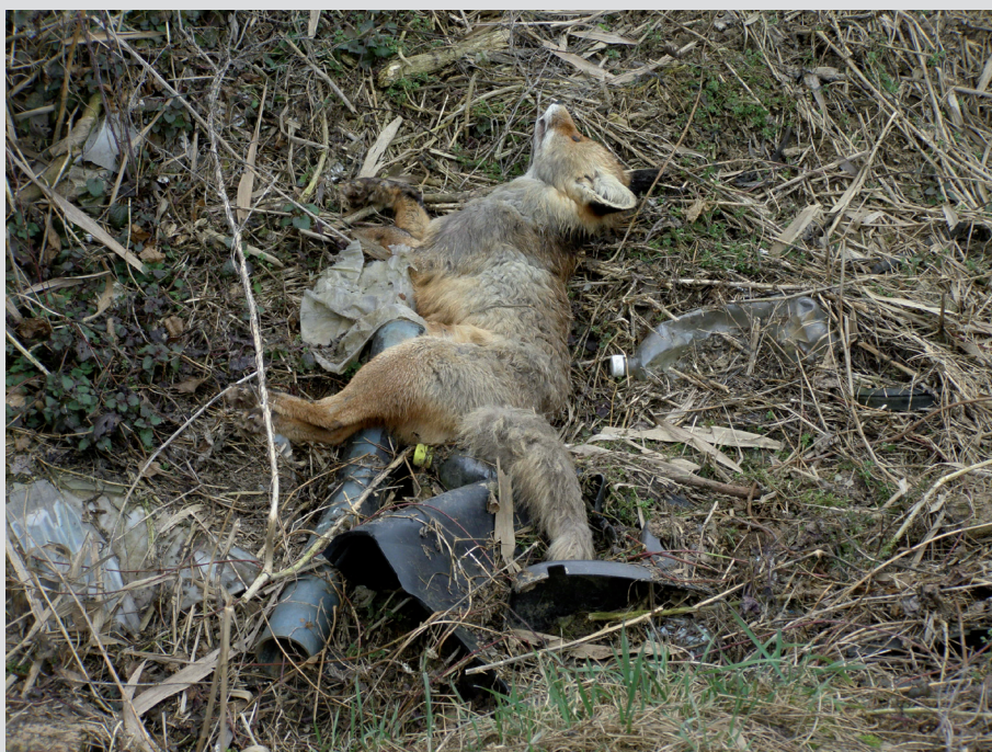
Foto 13: Nelegálne skládky odpadu, napr. z poľnohospodárstva, môžu spôsobiť otravu živočíchov.