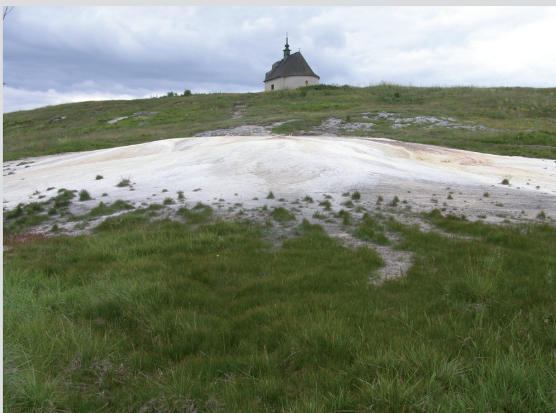
Foto 4: Travertínové kopy a asociované mokradové a slanomilné biotopy sú veľmi zraniteľné na zmenu vodného režimu ale aj chemizmu podzemných vôd, z ktorých sú napájané.