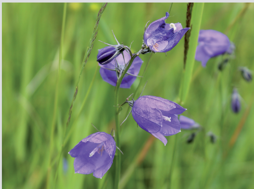
Foto 6: Na Slovensku sa vyskytujú populácie 43 druhov rastlín európskeho významu. Pri ich poškodení alebo zničení môže dôjsť k environmentálnej škode. Zvonček hrubokoreňový ( Campanula serrata ).

Skúsenosti z praxe ukazujú, že je dosť ťažké spätne odhadnúť početnosť zničenej populácie druhov európskeho významu. Aj keď je možné použiť niektoré naznačené aproximácie, je potrebné brať do úvahy aj fakt, že odhad je v tomto prípade súčasťou znaleckého posudku alebo odborného stanoviska v rámci trestného, prípadne súdneho konania. Veľká neistota v odhade škody môže vyústiť do spochybnenia posudku alebo stanoviska zo strany páchatela. V praxi sa preto iba zriedkavo určuje škoda podľa počtu zničených jedincov chránených rastlín v prípadoch, kde z konkrétnej zasiahnutej plochy neboli záznamy o výskyte a početnosti chránených druhov rastlín pred zásahom. Oveľa častejšia je situácia, že rastliny rastú v biotope európskeho významu. V tom prípade sa berie do úvahy spoločenská hodnota poškodených alebo zničených biotopov a tá sa následne môže zvýšiť až o 100% , ak ide o biotop chránených druhov rastlín.