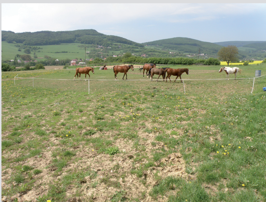
Foto 11: S nadmernou pastvou je spojené riziko zošľapu a poškodenia travinných biotopov.

Podkladom pre určenie environmentálnej škody by vždy malo byť stanovisko odbornej organizácie ochrany prírody alebo znalecký posudok. Ak sa spoločenská hodnota znižuje v dôsledku nepriaznivého stavu zachovania biotopu, je možné ju určiť v zmysle vyhlášky MŽP SR č. 24/2003 Z. z. iba znaleckým posudkom.