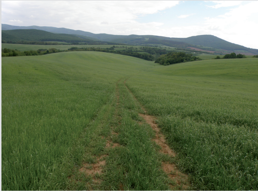
Foto 1: Intenzívna poľnohospodárska činnosť v svahovitom teréne prináša mnohé riziká, napr. v podobe splachu živín do okolitých biotopov. Pravidelný zvýšený prísun živín môže poškodiť okolité prírodné biotopy.