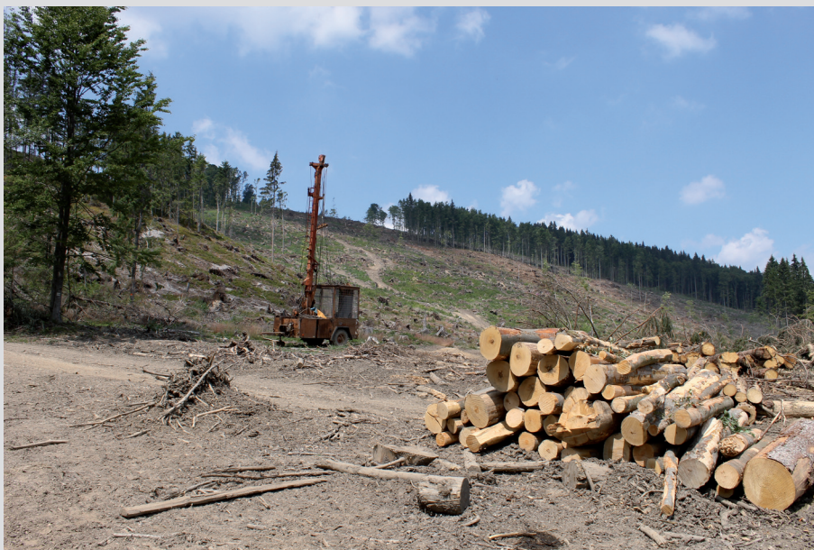
Foto 14: Veľkoplošná ťažba lesných porastov v reakcii na gradáciu početnosti podkôrneho hmyzu môže spôsobiť devastáciu lesných biotopov na veľkých plochách. Autor: Dobromil Galváneek

Je tiež potrebné upozorniť na to, že tento kľúč nie je úplne vyčerpávajúci, čo sa týka postupu konania. Kvôli väčšej prehľadnosti a zjednodušeniu sme sem nezaradili napr. riešenie cezhraničných vplyvov alebo detaily prípadného odvolacieho konania.