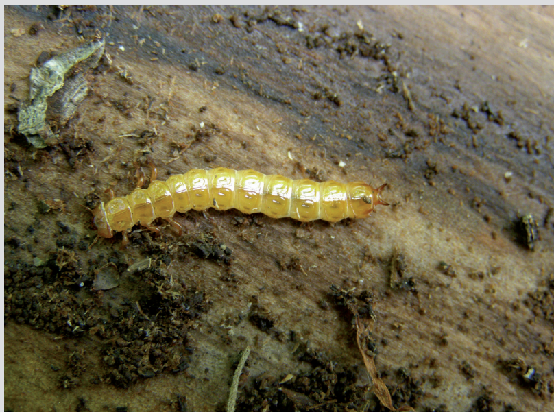
Foto 7: Lesy s prírodou blízkym obhospodarovaním obýva viacero druhov chrobákov európskeho významu, ktorých larvy sú viazané na hrubé mŕtve drevo v rôznom štádiu rozkladu. Jeho ponechávanie v porastoch je hlavnou podmienkou zachovania týchto druhov. Larva plocháča červeného ( Cucujus cinnaberinus ).

Ako sme už uviedli skôr, v prípadoch, kde neexistujú priame dôkazy o poškradení/zničení chránených druhov živočíchov, resp. údaje o výskyte (a najlepšie aj početnosti) chránených druhov živočíchov na poškodenej lokalite, sa pre účely určenia škody na chránených živočíchoch používa skôr prirážka 100% k spoločenskej hodnote poškradených alebo zničených biotopov. Obmedzením je, že táto sa určuje len pre chránené typy biotopov (európskeho alebo národného významu).