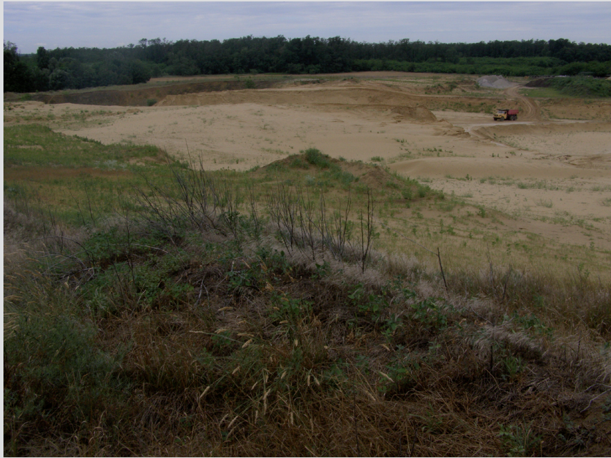
Foto 2: Ťažba nerastných surovín, v tomto prípade pieskov, síce spôsobuje ničenie biotopov pieskových dún, ale ak je riadená a nasledovaná revitalizačnými opatreniami, môže vytvoriť hodnotné náhradné plochy pre vznik psamofilných biotopov a na ne viazaných vzácných druhov flóry a fauny.