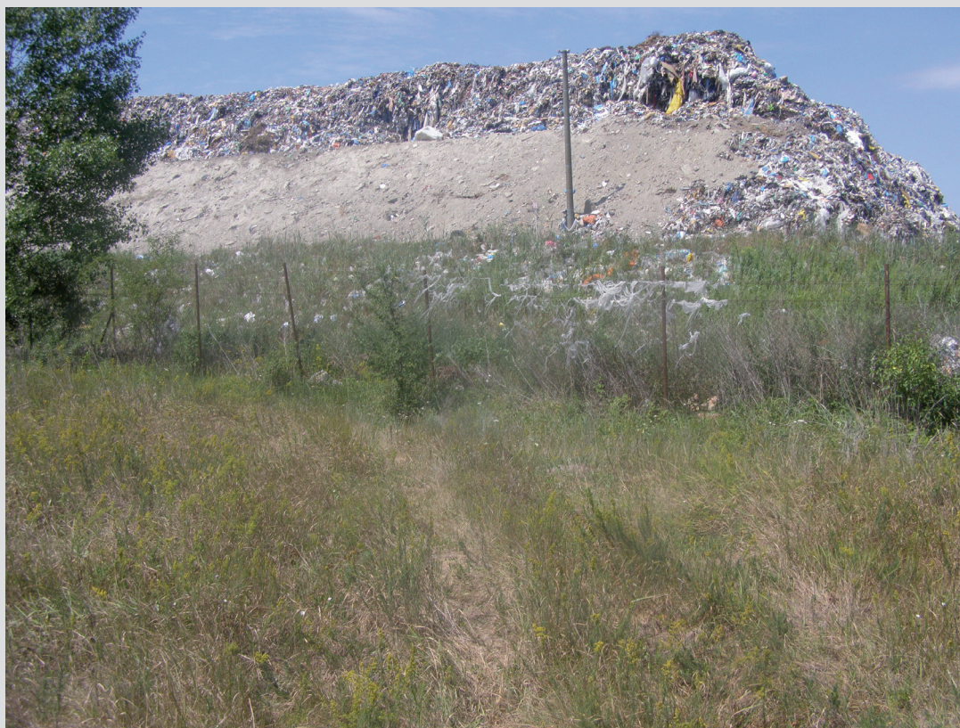
Foto 9: S prevádzkovaním skládok odpadu sú spojené riziká vzniku bezprostrednej hrozby environmentálnej škody, ako aj škody na druhoch a biotopoch európskeho významu. SKUEV0076 Bokrošské slanisko.

Pri niektorých typoch zásahov (napr. rozoranie, odstránenie pôdneho krytu, pevná stavba a podobne) sú hranice zasiahnutej plochy evidentné, v iných prípadoch (napr. únik alebo aplikácia chemickej látky) môžu byť hranice poškodenia difúzne a vtedy je potrebné, aby meranie vykonala, resp. bola pri ňom prítomná osoba s dostatočnou fytoecologickou skúsenosťou, ktorá na základe floristického zloženia vegetácie posúdi hranice zasiahnutej plochy.