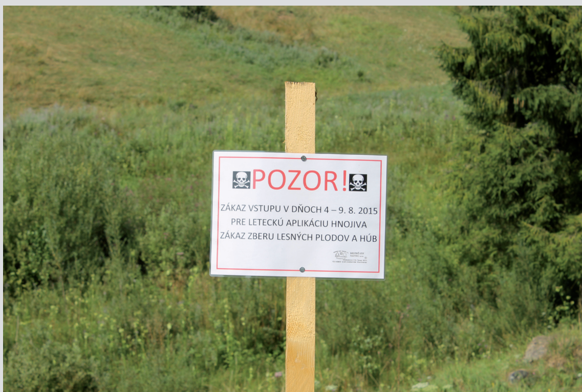
Foto 12: Letecká aplikácia hnojív alebo chemických látok je spojená s nemalým rizikom vzniku environmentálnej škody v dôsledku zasiahnutia necieľových plôch.

Klasifikáciu ekosystémových služieb je možné nájsť na stránke www.biodiversity.europa.eu/maes . Niektoré metodické postupy uvádza práca Bucur & Strobel (2012). V poslednom období sa na Slovensku publikovalo viacero prác, ktoré sa venujú hodnoteniu ekosystémových služieb, najmä v národných parkoch v horských oblastiach Slovenska. Napríklad štúdiu zameranú na hodnotenie ekosystémových služieb biotopov v NP Muránska planina s odkazmi na ďalšie práce a metodické postupy uvádzajú Považan et al. (2015). Aj napriek tomu ide stále o pomerne náročnú úlohu. Hlavným problémom tu môže byť najmä nedostatok vstupných údajov pre jednotlivé výpočty, resp. vysoká náročnosť ich získania.